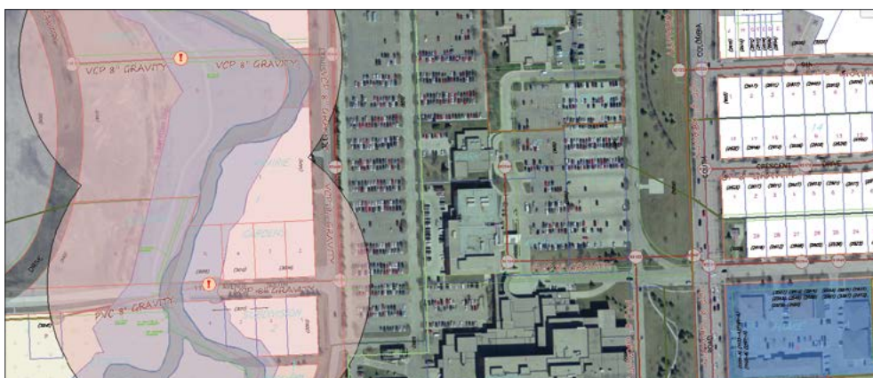
Přístup k aktuálním informacím umožňuje lepší analýzy. Analýza přírodních rizik bere v úvahu potenciální odtokové oblasti ovlivněné kanalizací, které jsou spravovány s pomocí průmyslových modelů v záplavové zóně.

Návrháři a manažeři mohou v aplikaci Autodesk AutoCAD Map 3D vrstvit různé hladiny GIS a CAD dat na sebe – vytvářejí tak ucelenější výchozí mapy existujících podmínek. Získají daleko přesnější pohled na návrhy, navíc v reálném kontextu. S pomocí aplikace Autodesk® Storm and Sanitary Analysis 2014, která je součástí produktu Map 3D, mohou uživatelé provádět hydrologické a hydraulické analýzy pro plánování městských kanalizačních systémů, dešťových a splaškových kanalizací. Kromě toho mohou uživatelé provádět prostorové analýzy, aby lépe pochopili dopad projektu a měli z čeho vycházet při klíčových návrhářských a manažerských rozhodnutích v raných fázích procesu. Komplexní knihovna souřadných systémů pomáhá přesněji georeferencovat data.