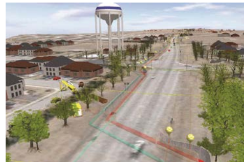
Autodesk InfraWorks.