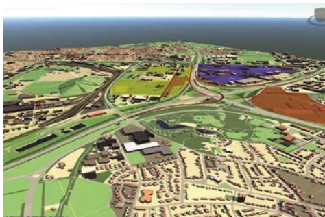
Podpořte investory s realistickými vizualizacemi projektu.