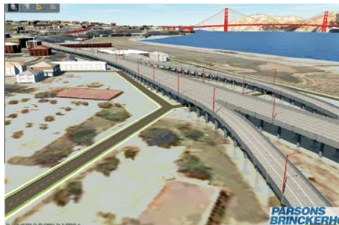
Sdělte jasný záměr návrhu a získejte tak potřebná schválení.