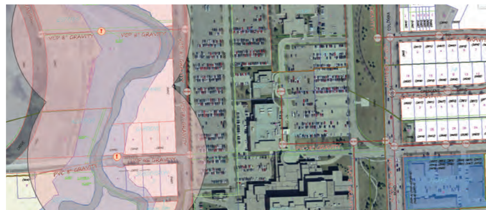
Přístup k aktuálním informacím umožňuje lepší analýzy. Analýza přírodních rizik bere v úvahu potenciální odtokové oblasti ovlivněné kanalizací, které jsou spravovány s pomocí průmyslových modelů v záplavové zóně.

Tvořte návrhy postavené na lepších informacích AutoCAD Map 3D pomáhá organizacím vytvářet lepší návrhy. Poskytuje přístup k datům potřebným pro plánování, navrhování a správu majetku. Uspodňuje členům týmu posouzení stávajících podmínek a vytvoření analýz koridorů, sítí či stavenišť.