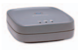
HP JETDIRECT EW2400 WIRELESS PRINT SERVER

Externí tiskový server určený pro zařízení s vysokorychlostním USB 2.0.