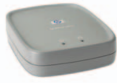
HP JETDIRECT EN3700

Tiskový server se širokou kompatibilitou a lehkou podporou laserových a inkoustových tiskáren umožňuje pracovním skupinám přistupovat k více než jednomu zařízení. Kompatibilní s protokolem IPv4 a IPv6.