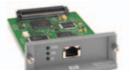
HP JETDIRECT 635N

Rychlý tisk. Kompatibilita. Ovladatelnost. Tento tiskový server dále nabízí připojení do sítě rychlostí až 1 Gigabit, podporuje protokoly IPv4 a IPv6.