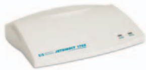
HP JETDIRECT 170X

Jedno z nejlépejších řešení, jak zapojit tiskárnu s paralelním portem.