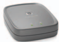
HP JETDIRECT EN1700

Jednoduché řešení pro rychlé připojení až třech tiskáren do sítě Fast Ethernet/Ethernet.