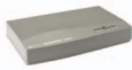
HP JETDIRECT 300X

Server určený pro tiskárny s portem USB s bohatými možnostmi konektivity.