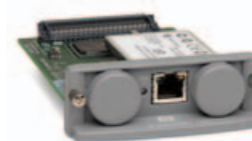
HP JETDIRECT 690N WIRELESS PRINT SERVER

Sdílejte širokou škálu zařízení s jedním z prvních gigabit EIO serverů s podporou IPv6, IPv4, IPv4sec.