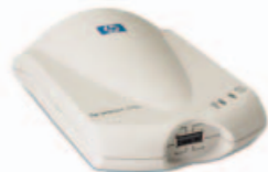
HP JETDIRECT 175X

Jedno z nejlépejších řešení, jak zapojit tiskárnu s paralelním portem.