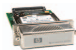
HP HIGH-PERFORMANCE EIO HARD DISK

Sdílení síťových periferních zařízení HP je s tímto bezdrátovým nebo kabelovým externím tiskovým serverem hračkou.