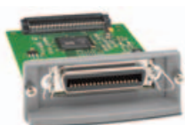
HP 1284B PARALLEL EIO CARD

Podpora produktivity a udržení zdrojů se silným výkonem.