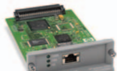
HP JETDIRECT 630N

Paralelní HP 1284B EIO karta představuje rozhraní paralelního portu pro kompatibilní periferní zařízení HP, které vám poskytuje flexibilní možnost nadále podporovat paralelní zařízení.